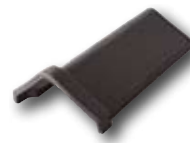
06. Firstziegel Nr. 220

Universelle Überdeckung mit Abschlussziegeln.