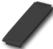
01. Halber Ziegel

Setzen Sie Ihrem Dach die Krone auf. Ob Neueindeckung, Renovierung oder Sanierung. Bei Laumans erhalten Sie neben dem perfekten Dach auch immer das gute Gefühl zu Hause zu sein. Ganz gleich ob es sich um ein ehrgeiziges architektonisches Projekt oder ein wirtschaftliches Bauvorhaben handelt. Mit Laumans Dachziegeln sind Sie immer auf der richtigen Seite: Optisch vollendet, technisch perfekt.