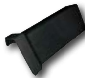
05. Universal-Pultfirstziegel Nr. 6800

Optisch kompakter Abschluss der seitlichen Dachfläche und Schutz des Dachanschlusses vor Schlagregen.