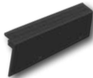
04. Ortgang rechts

Optisch kompakter Abschluss der seitlichen Dachfläche und Schutz des Dachanschlusses vor Schlagregen.