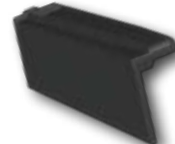
03. Ortgang links

Zusätzliche Flächenbe- und -entlüftung im Trauf- und Firstbereich sowie für Dachaufbauten.